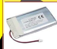
内蔵式バッテリー