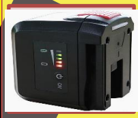
着脱式バッテリー