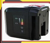
着脱式バッテリー