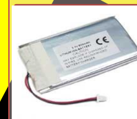
内蔵式バッテリー