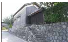
輪之内町の特徴的な風景

輪中とは、川に囲まれたデルタ地帯をいいます。たびたび洪水に襲われる場所でありながら、ここに耕地をひろげ、人が住みついたのは、川によってもたらされる肥沃な土壌と枯れることのない豊かな水資源があるからでした。洪水により水とともに山の方から栄養豊富な土や砂が運ばれてくるので、水が引いた洪水の次の年はいつもの二倍ほどの作物が収穫されたといわれています。このような場所は、全国を見渡しても、この辺り、つまり木曾三川周辺にしかありません。現在は河川の改修が進み、水害は見られなくなっているのですが、昔の名残が残っていて、輪中にしかない珍しい景観があちこち見られます。水害から守る堤防が築かれ、屋敷は地域内の高い所に建てられています。なかでも特徴的なのは、水屋です。もともと石積みにして周囲よりも高台にした土地に母屋が建っていますが、水屋はさらに一段と高い石積みの上に建てられています。これは、水害で母屋が浸水することを想定したもので、水屋には、寝具や衣類、食料などが備蓄され、洪水時には水が引くまで生活したそうです。自然に勝つことはできないが、人の命だけは守り抜く。輪中には、今でこそ 学ぶべき防災意識を見つけることができます。