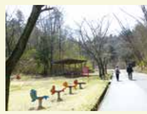
木製遊具など、子どもの遊び場が点在しています。

岐阜県百年公園 岐阜県関市小屋名 1966 TEL 0575-28-2166 岐阜県博物館 岐阜県関市小屋名 1989 TEL 0575-28-3111