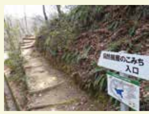
道標がしっかりしていて、気軽に自然に親しめます。