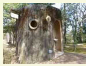
トイレが木の切り株の形になっています。