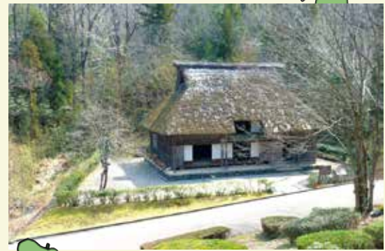
旧徳山村から古民家が移設されています。

岐阜県百年公園 岐阜県関市小屋名 1966 TEL 0575-28-2166 岐阜県博物館 岐阜県関市小屋名 1989 TEL 0575-28-3111