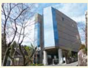
里山に親しんだら、園内にある「岐阜県博物館」へ。