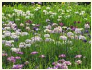
菖蒲とともに、里山の景色を楽しめます。