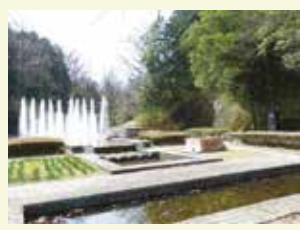
北口を入ってすぐにある噴水広場。