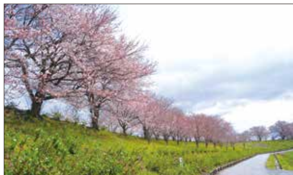
本戸地区 輪中堤の桜