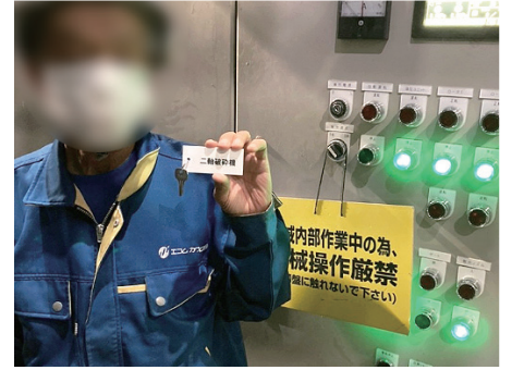
③操作キー抜き取り