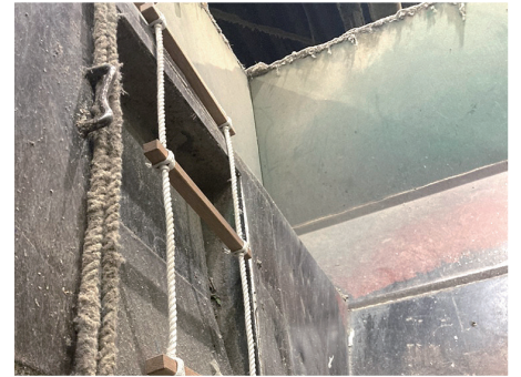
⑥機械内部からの避難用ロープ準備 (人数分)

◎作業開始申請をした、関係者全員から開始許可の返信が届くまで、作業を開始することはできない