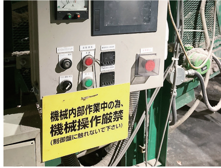
②制御盤周辺封鎖状況