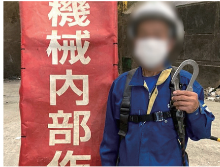
⑤安全帯準備 (人数分)