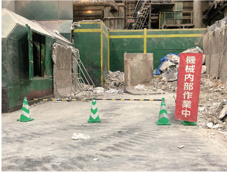
①機械周辺封鎖状況

◎機械内部での作業許可を得る為、携帯端末の【メッセージ機能】を使用して、関係者へ作業開始を報告する。その際に、現場の状況が分かる様に、撮影した写真も添付する。