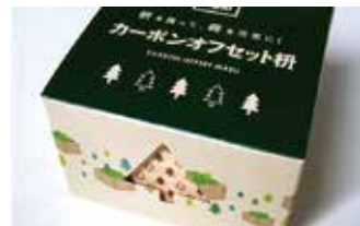
カーボンオフセット枡：カーボンオフセット対象商品の価格の一部をJ-VER制度という環境省の進める仕組みを通して、中津川市にある加子母森林組合の活動を支援する費用の一部としています。