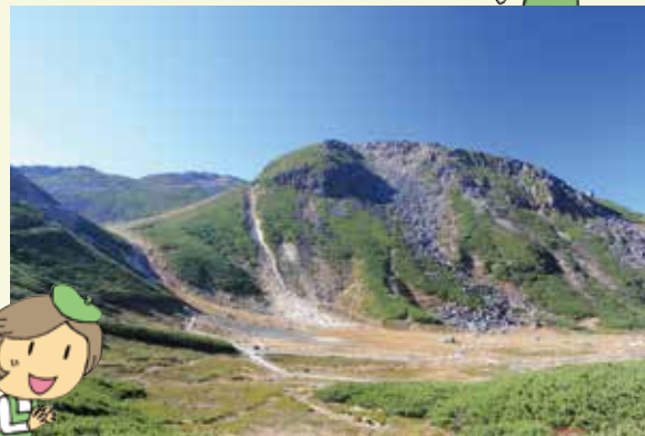
乗鞍岳・壘平(岐阜県高山市)

今年から、「ぎふ山の日」はなくなる けど、「ぎふの山に親しむ月間」によ り、岐阜の山の魅力、循環型の森 林づくりをアピールしていくよ。