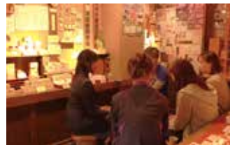
インターンシップの受け入れも実施。今回はNPO(アイセック)を通じて、ルーマニアの学生を半年間受け入れました。

工場を出た檜のかんなクズでマスト部分を作成。水分を吸うと、ほどよい潤いとヒノキのほのかかな香りを与えます。「おもてなしセレクション2014」金賞を受賞しました。