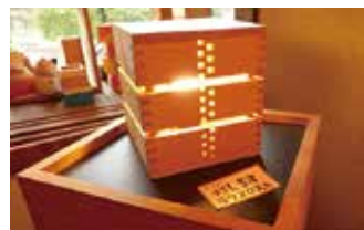
「灯します」は、人気のランタンです。