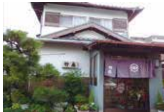
地元おいしい食材があるのだから、それを使った料理店はぜひあってほしい。「竹扇(ちくせん)」は、それを実現してくれているお店です。

「れんこんカツ丼」／コンクールにて入賞。店でも出せないかという周囲の声があり、メニューに取り入れることに。れんこんとお肉の相性が抜群の一品。