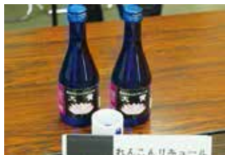
食前酒の「れんこんりきゅる大賀(千代菊)」は、ほのかにれんこんの香りがします。

「竹扇」 岐阜県羽島市竹鼻町丸の内3-17(羽島市文化センター南、市民の森公園前) TEL:058-393-0228 【営業時間】11:00～14:00 【定休日】月曜日(祝日も月曜日は休み)