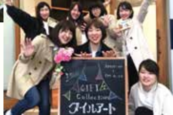
多治見のタイルアートイベントにて