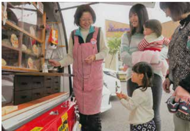
みんな大好きな「ロバのパン」。3世代が触れ合う場面になっています。

「ロバのパン」は、昭和の初めからフランチャイズチェーンの先駆けとして、パンの移動販売を全国展開していました。ユニークなのは、音楽による宣伝方法。庶民は誰もが貧しかった頃ですから、楽し気なメロディが聞こえてくると、みんなソワソワしたようです。そんな「ロバのパン」が岐阜エリアに復活したのは、2009年。年齢を重ねた方には懐かしく、若い人には斬新さを感じさせる再登場でした。老人福祉施設への訪問など、パンの移動販売を通して、地域を盛り上げています。