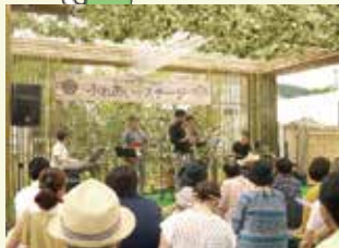
野外ステージでは、プロ・アマによる自由な発表が催されたよ。