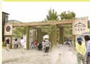
みんなの森ぎふメディアコスモスが会場となったよ。