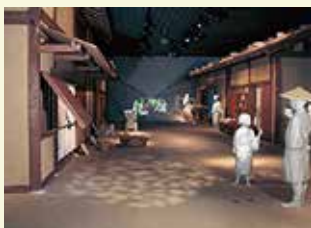
楽市楽座の様子。(岐阜市歴史博物館)先を行っていたまちだったんだね。