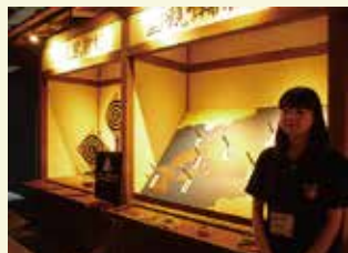
「信長公ギャラリー」では、CG映像や体験型の展示が楽しめるよ。